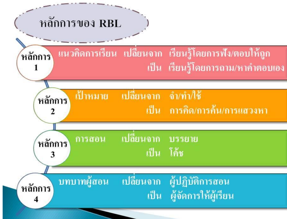
ภาพที่ 1 หลักการสอนแบบโครงงานฐานวิจัย

2. ศึกษาความรู้ และเข้ารับการอบรมในรูปแบบต่าง ๆ เกี่ยวกับการจัดกิจกรรมการเรียนรู้แบบโครงงาน ฐานวิจัย